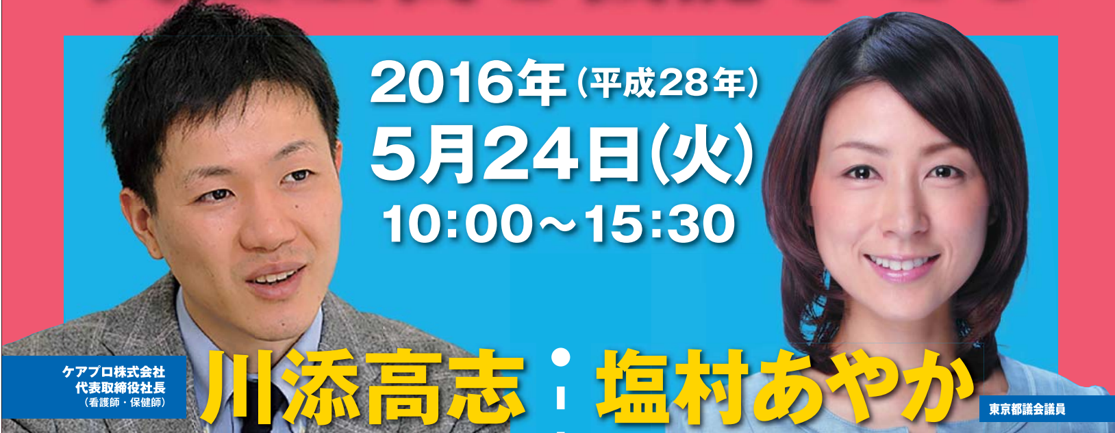
ケアプロ株式会社 代表取締役社長 (看護師・保健師)